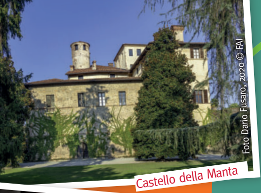
Castello della Manta