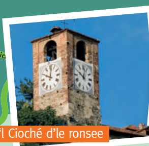
'l Cioché d'le ronsee