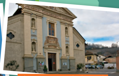
Chiesa S. Maria degli Angeli