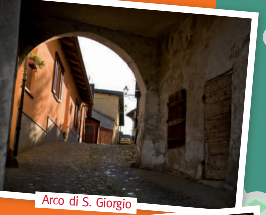
Arco di S. Giorgio