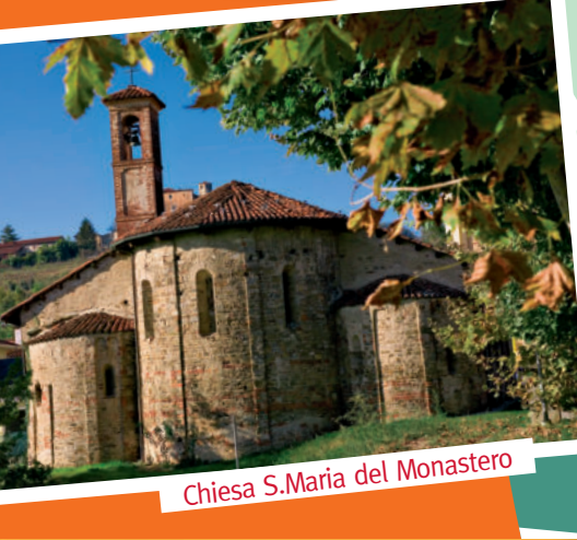
Chiesa S. Maria del Monastero